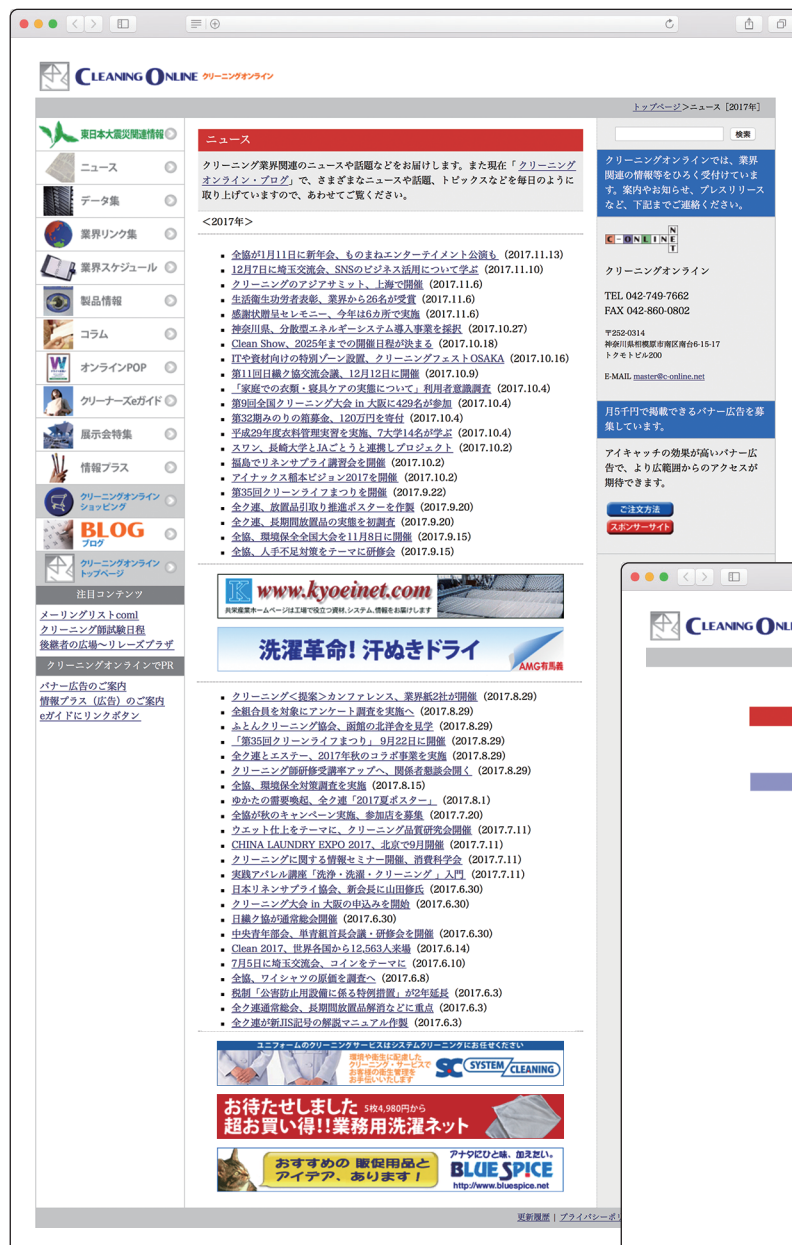
バナー広告掲載例

クリーニングオンラインは1996年よりインターネットで情報提供を行っている クリーニング業界関連ではトップクラスの情報サイトです。